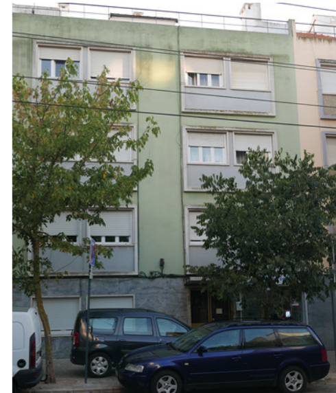
1961 Rua de Pedrouços, nº 69, 3º andar

Foi o último dirigente do PCP a sair da clandestinidade.