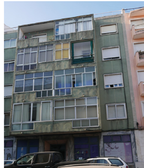
1959/61 Rua dos Lusíadas, nº 8 – 3º esq/fr