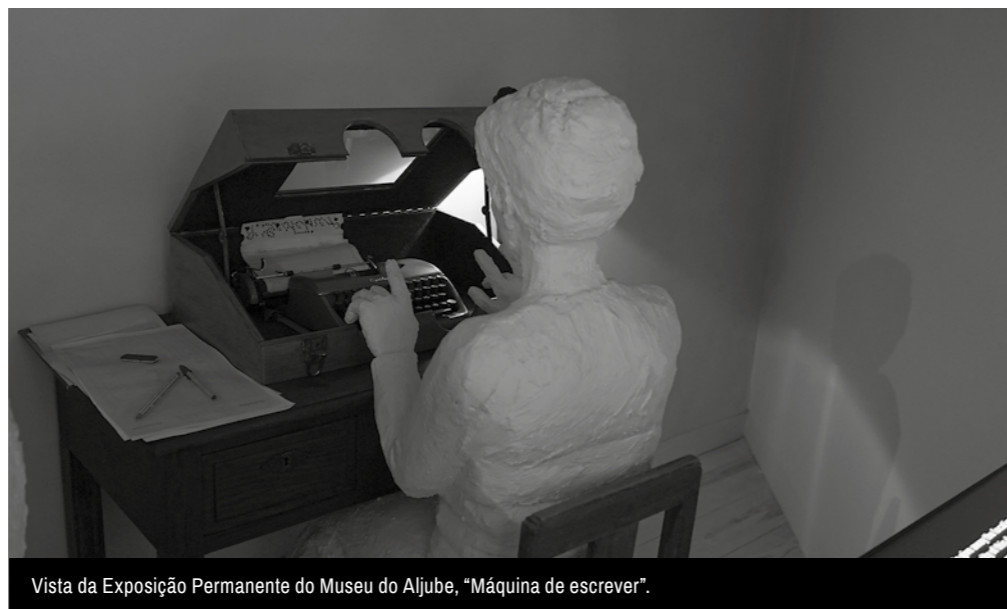
Vista da Exposição Permanente do Museu do Aljube, “Máquina de escrever”.

Imagem da capa: Vista da Exposição Permanente do Museu do Aljube, “Reunião Clandestina”.