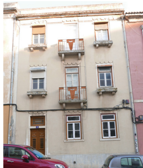
1937/38 Rua Francisco Tomás da Costa, nº 4, r/c